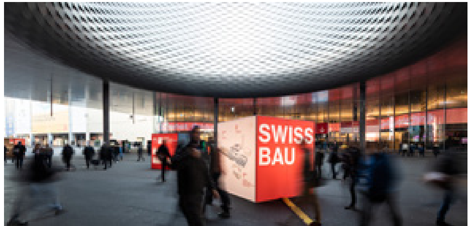
Die Swissbau 2024 verspricht wieder eine ganz starke Messe zu werden.

Die Swissbau 2024 versteht sich als interdisziplinäre Plattform für Architektur, Planung und Handwerk, Immobilienwirtschaft sowie Eigentümerinnen und Investoren. Getreu dem Motto «Den Wandel gemeinsam gestalten» werden Neuheiten und Lösungen präsentiert, diskutiert und erarbeitet – mit dem Ziel, den gesellschaftlichen Herausforderungen rund um Globalisierung, Digitalisierung und Klimawandel als Branche zu begegnen.